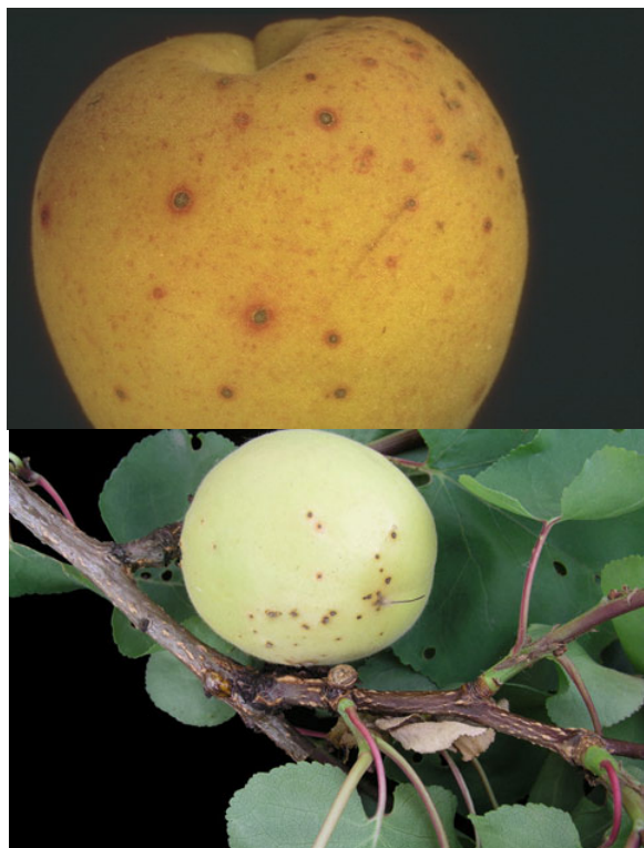
Εικόνα 2. Προσβολή από Κορύνεο σε φύλλα και καρπούς Βερικοκιάς