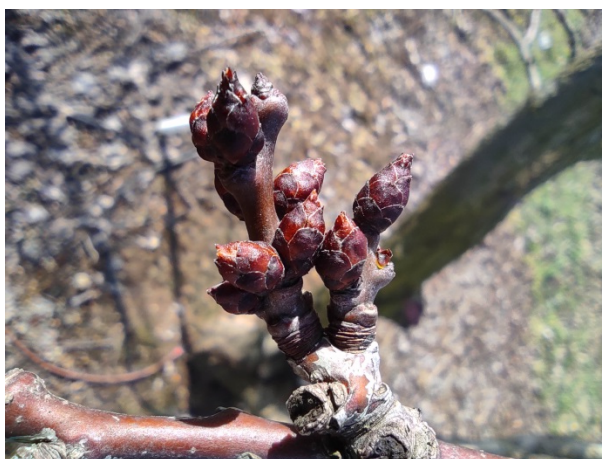
Εικόνα 3. Ποικιλίες Βερικοκιάς στην Ημαθία