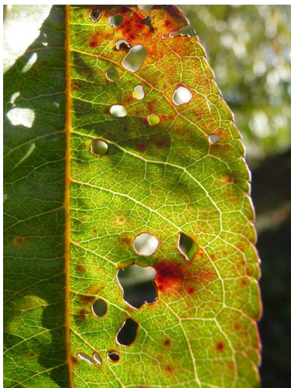
Εικόνα 1. στάδια ΒΕΡΙΚΟΚΙΑΣ